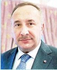
Ali KOPUZ / İstanbul Ticaret Borsası Yönetim Kurulu Başkanı

Tarım ve gıda dış ticaret fazlası veren sektörlerimizden olmasına rağmen, tarımda girdi fiyatları enflasyonu ve gıdadaki üretici ve tüketici enflasyonu, maalesef tüm kesimleri zorlayan konular olarak 2024 yılı boyunca gündemden düşmedi. Diğer taraftan, sadece gıda sektörü için değil, tüm kesimlerde gıda sahtekârlığının, taklit ve tağşiş konusunun çok ciddi bir sağlık ve ekonomik sorun olarak karşımıza çıktığı bir sene oldu. Bu konuda da en çok yine biz mücadele ettik ve etmeyi de sürdüreceğiz. Kamu otoritesine